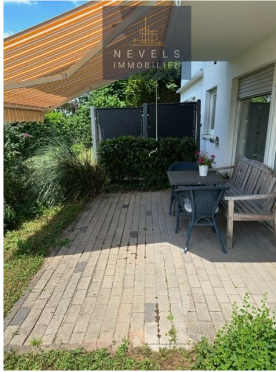
Terrasse mit Markise