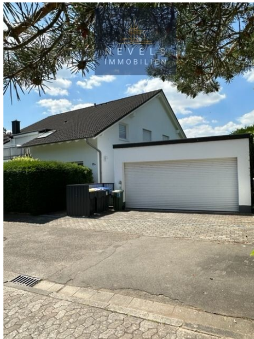
Garage für 4 Fahrzeuge