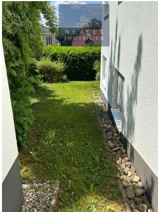
Seitlicher Garten zur Wohnung