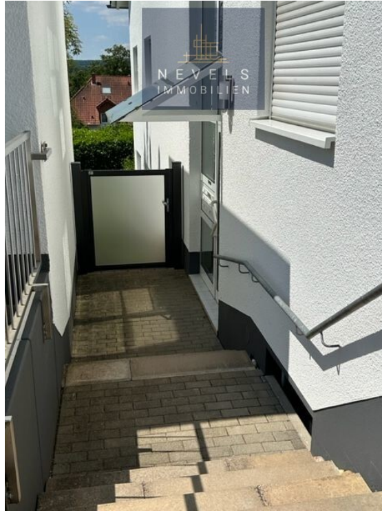
Zugang zur Wohnung