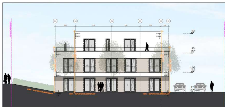
ANSICHT NORD-OST M 1:100