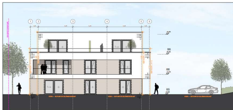
ANSICHT SÜD-OST M 1:100