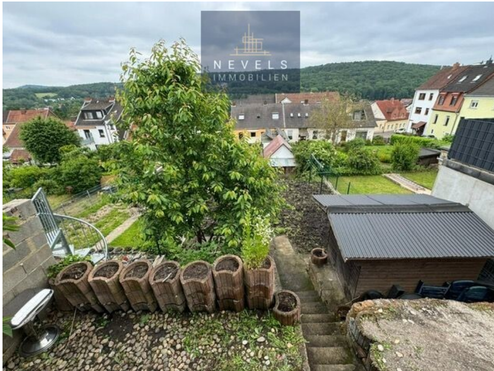
Gartenansicht von Terrasse