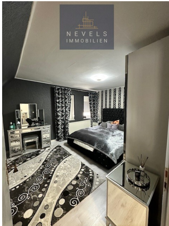
Schlafzimmer OG links