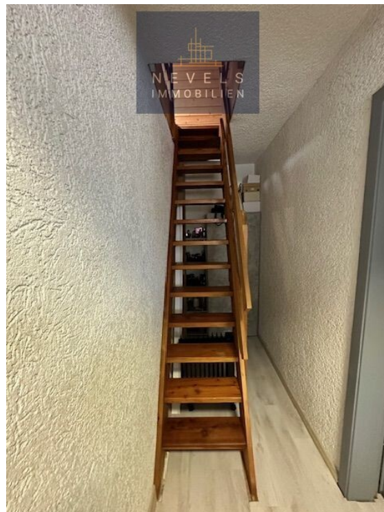
Treppe zum Dachgeschoss