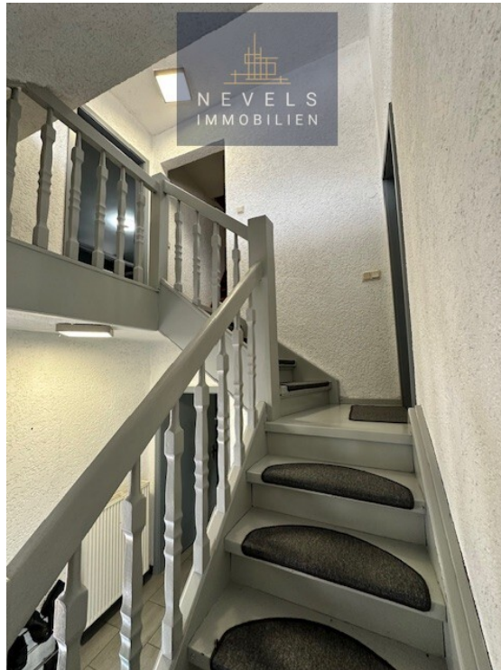
Treppenaufgang zum OG