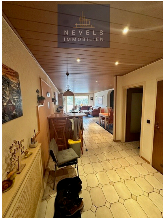
Wohn und Esszimmer