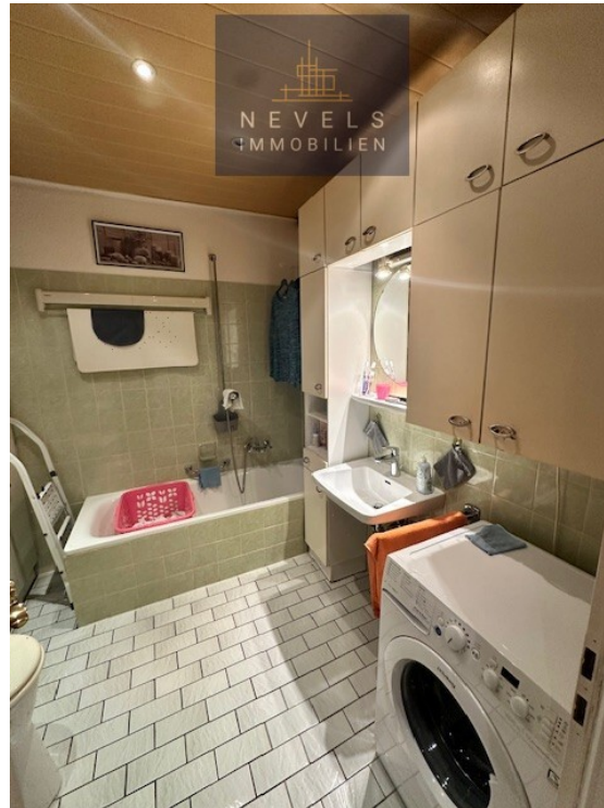
Hauptbad inkl. Badewanne