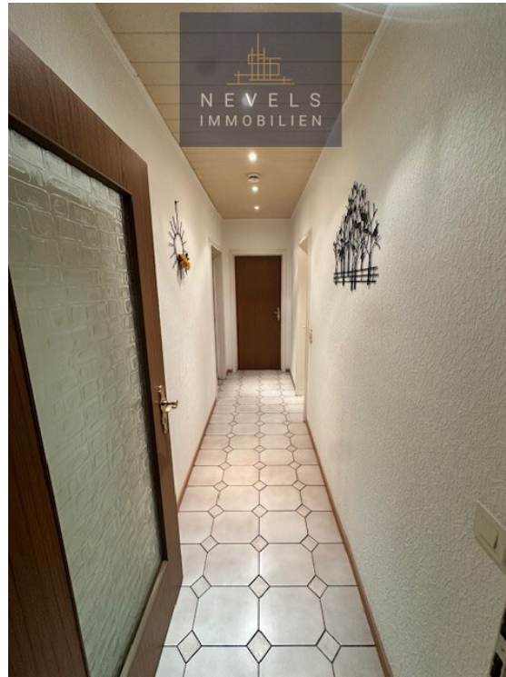
2. Flur zum Bad und 2 Schlafzimmern