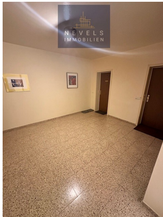
Plateau vor Wohnungseingang