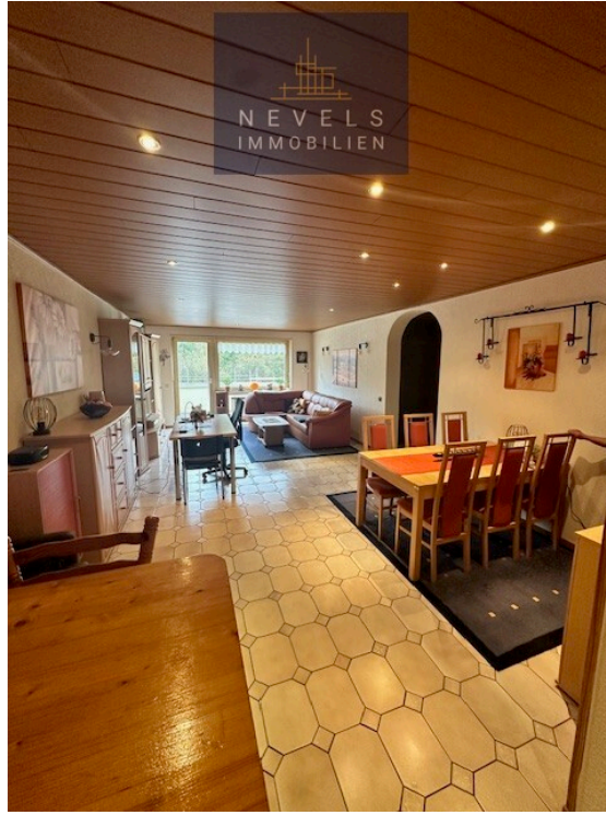
Wohn und Esszimmer (2)