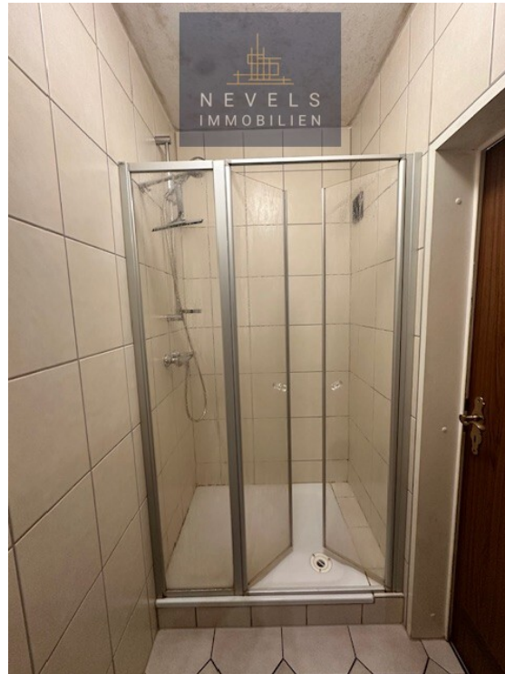
Dusche vor Gäste WC