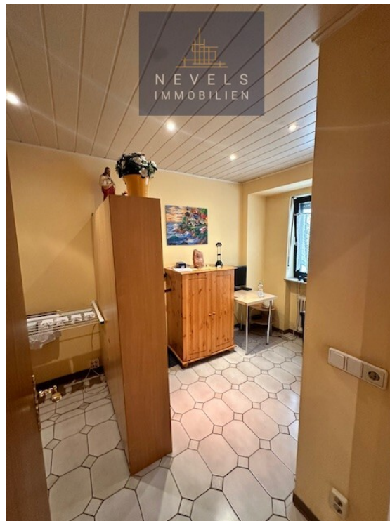
Schlafzimmer oder Büro