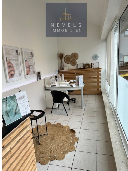
Gewerbeinheit im Erdgeschoss