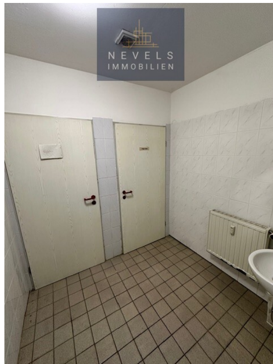
Toiletten im Keller