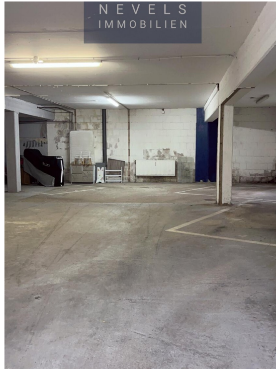
Tiefgarage linker Teil