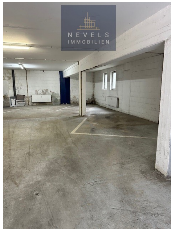
Tiefgarage rechter Teil