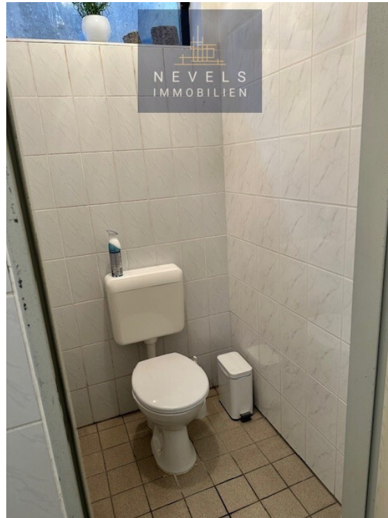
Toilette im Keller