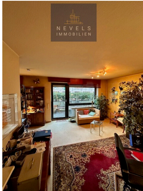
Wohn und Esszimmer