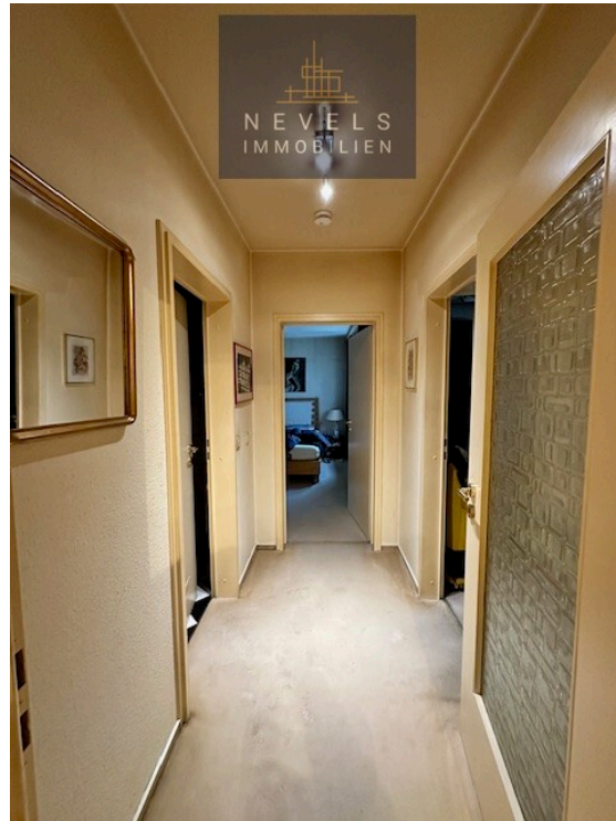
Flur zum Schlafzimmer